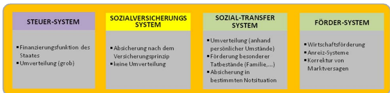
Die vier Subsysteme des neuen Gesamtsystems

Ein optimales System kann daher niemals das Steuersystem allein betrachten, da mehrere Subsysteme (Steuer, Sozialversicherung, Sozialtransfers und Förderungen) unmittelbar ineinander greifen. Aus den fundamentalen Hauptsätzen der Wohlfahrtsökonomik, die eine Grundlage der modernen Finanzwissenschaft darstellen, kann abgeleitet werden, dass die Frage der (Um-)Verteilung unabhängig von den anderen Aufgaben des öffentlichen Sektors gelöst werden kann. Das bedeutet aber, dass die Frage der „Maximierung des Kuchens insgesamt“ und jene der „Verteilung des Kuchens“ nicht nur konzeptionell getrennt werden können, sondern im Sinne eines transparenten und leistungsfähigen Systems getrennt werden müssen. Jedes der genannten Subsysteme sollte also von den anderen klar getrennt und für sich funktionsfähig sein („Nachhaltigkeit und Unabhängigkeit der Subsysteme“) und hat somit unterschiedliche Aufgaben zu erfüllen: